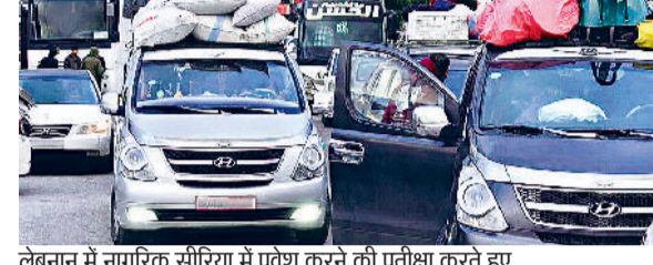
लेबनान में नागरिक सीरिया में प्रवेश करने की प्रतीक्षा करते हुए

ईरान के विदेश मंत्री सैयद अब्बास अराघची ने अमेरिका के साथ फिर से वार्ता की संभावना को पूरी तरह खारिज कर दिया। उनका कहना है कि अमेरिका के साथ पिछली बातचीत में भरोसा टूट चुका है और बार-बार हुए हमलों के कारण अब कूटनीति की कोई संभावना नहीं बची। अराघची ने कहा कि इस साल भी अमेरिका ने आश्वासन दिया कि हमला नहीं होगा और परमाणु मुद्दे का शांतिपूर्ण समाधान निकाला जा सकेगा, लेकिन इसके बावजूद अमेरिका ने आक्रमण किया। उन्होंने कहा कि अब अमेरिका के साथ बातचीत उनकी प्राथमिकता में नहीं है। नए सर्वोच्च नेता मोजतबा खामेनेई के चयन को अराघची ने स्थिरता का संकेत बताया। उन्होंने कहा कि नए नेता की नीतियां धीरे-धीरे सामने आएंगी। अराघची ने कहा कि अमेरिका और इजराइल सोच रहे थे कि कुछ दिनों में शासन परिवर्तन या तेज जीत हासिल कर लेंगे, लेकिन उन्हें सफलता नहीं मिली। तेल की वैश्विक आपूर्ति और कीमतों में वृद्धि के लिए ईरान को दोष देने की बात पर अराघची ने कहा कि यह उनकी योजना नहीं है। तेल उत्पादन और परिवहन में बाधा अमेरिकी और इजराइली हमलों के कारण हुई है। इसी वजह से होर्मुज जलसंधि में जहाज सुरक्षित नहीं महसूस कर रहे हैं। उन्होंने दोहराया कि ईरान अपने मिसाइल हमलों को तब तक जारी रखेगा जब तक जरूरत होगी और जब तक अपने लोगों और देश की रक्षा जरूरी होगी।