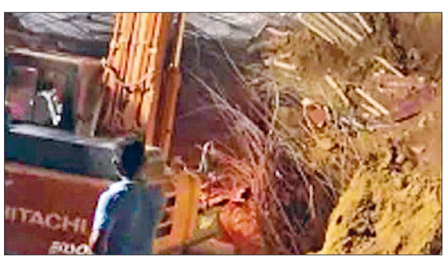
गुरुग्राम। सिधरावली के पास सिग्नेचर ग्लोबल कंपनी की कंस्ट्रक्शन साइट पर मिट्टी दबने से दबे मजदूरों को जैसीसी बें निकालने का प्रयास करते बचावकर्मी।