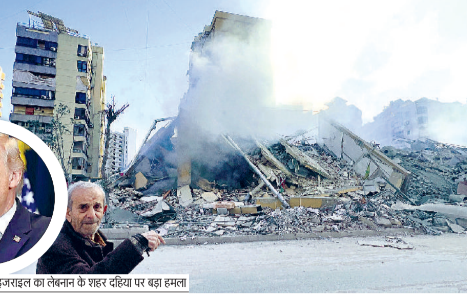
इजराइल का लेबनान के शहर दहिया पर बड़ा हमला

आईरिस डेना पर ट्रंप का शर्मनाक बयान: युद्धपोतों को डुबोने में मजा आता है ईरान के जहाज आईरिस डेना पर हिंद महासागर में हुए हमले को लेकर अमेरिका के राष्ट्रपति डोनाल्ड ट्रंप की पहली प्रतिक्रिया सामने आई है। उन्होंने कहा है कि उनके सैनिकों को ईरानी जहाजों को डुबोने में मजा आ रहा है। उन्होंने अपने अधिकारियों से हुई बातचीत का किस्सा सुनाते हुए कहा कि उन्हें 'ईरानी जहाजों को मारकर डुबोने में मजा आ रहा है।'